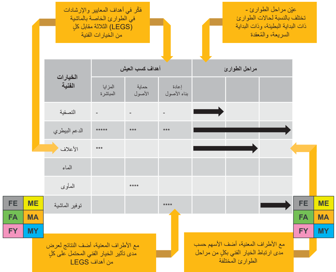
الشكل 3: منظور النوع الاجتماعي والعمر مقترنًا بمصفوفة تحديد الاستجابة التشاركية لمعايير وإرشادات LEGS

يعرض الشكل 3 مثالاً يوضح كيف يمكن إدماج هذا المنظور في مصفوفة تحديد الاستجابة التشاركية (PRIM) في كتيب LEGS، ورفع مستوى وعي الأطراف المعنية بفئات النوع الاجتماعي-العمر.