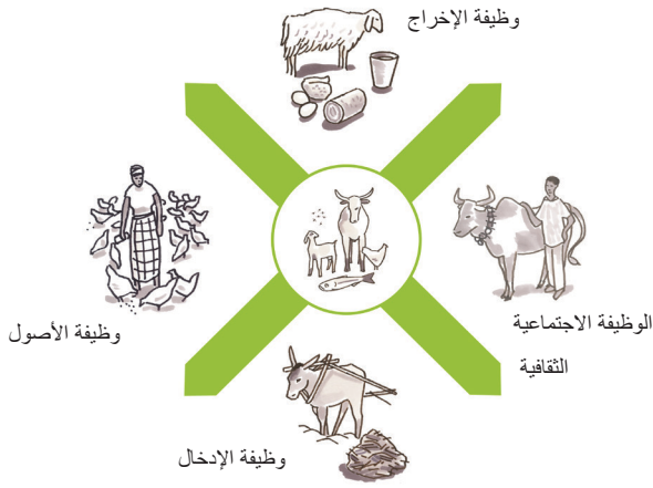
الشكل 1: الوظائف الأربع للماشية

من المهم تحديد أوجه الضعف الموجودة مسبقًا من منظور يراعي النوع الاجتماعي عند التخطيط لطرق الاستجابة الإنسانية وتحديد المجموعات المستهدفة الملائمة: