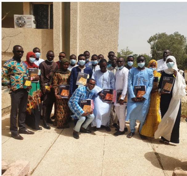
Burkina Faso Training, 2021

Para más información, visite livestock-emergency.net .